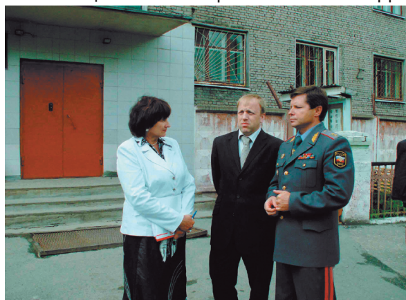
Совместное инспектирование ИВС Березниковского УВД Уполномоченным по правам человека в Пермской области Марголиной Т.И., начальником ГУВД Пермского края Горловым Ю.Г. и Главой г. Березники Мотовиловым А.В.