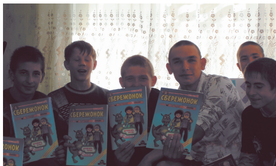
Воспитанникам «Пермяковского детского дома» к началу учебного года подарен журнал по правовому просвещению детей «СБЕРЕЖОНОК».

На обеспечение права каждого ребенка Пермского края жить и воспитываться в семье ориентирована также программа реструктуризации детских домов , предполагающая поэтапное