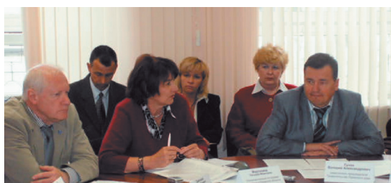
Заседание Межведомственного Совета по созданию системы ювенальной юстиции в Пермском крае

«Государство-участник в качестве первоочередных мер должно гарантировать, чтобы с детьми, не достигшими возраста наступления уголовной ответственности, не обращались как с криминальными элементами».