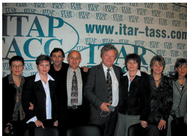
Председатель Комитета ООН по правам ребенка Джоан Дюк с региональными Уполномоченными по правам ребенка на конференции: «Права ребенка в Российской Федерации сегодня и перспективы на будущее» (Москва)

В 2007 году институт Уполномоченного по правам человека в Пермской области должен приобрести статус краевого.