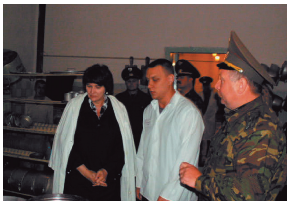
Осмотр условий приготовления пищи в ФГУ ИК–40 в г. Кунгур

В ходе совместного посещения учреждения с прокуратурой края и представителями ГУФСИН в феврале 2006 г. было установлено, что в связи с отдаленностью колонии, отсутствием какой–либо современной связи и инфраструктуры, учреждений медико–социальной сферы имелась острейшая проблема по укомплектованию штата профессиональными кадрами. Какая–либо компьютерная и печатная оргтехника в учреждении отсутствовала, что затрудняло работу учреждения по оформлению