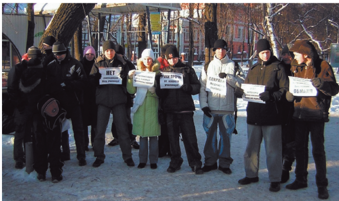
Протестная акция студентов медицинского училища декабрь 2006 года

Уполномоченным зафиксирована ситуация, когда недостаточность информации и нежелание должностных лиц предоставить эту информацию своевременно, в полном объеме и в корректной форме привело к активным протестным действиям.