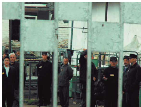
Уполномоченным зафиксирован факт проживания осужденных под открытым небом в ФГУ ИК-40 в г. Кунгур

В ходе «Круглого стола», проведенного Пермским региональным правозащитным центром на тему нарушений прав граждан в ИВС, была выявлена проблема существенного нарушения 10-дневного срока содержания в ИВС обвиняемых и подсудимых, совершенном по указанию органов прокуратуры и суда в нарушение требований ст.