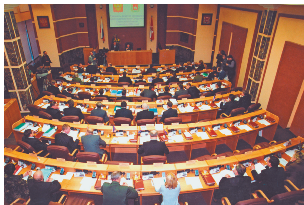
Заседание Законодательного Собрания Пермского края

В 2006 году были утверждены Концепция Устава Пермского края и Концепция Программы социально-экономического развития региона, что определило перспективы развития вновь созданного субъекта федерации.