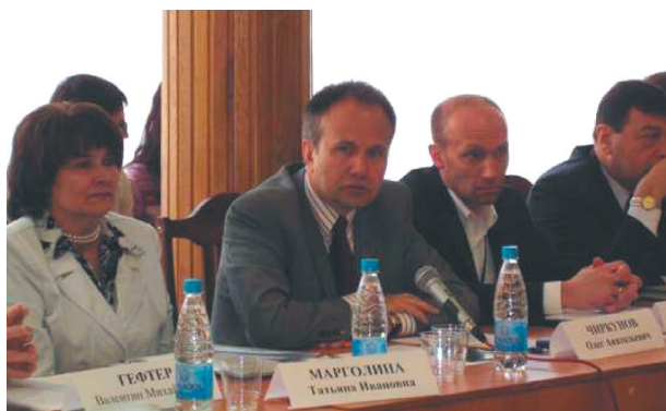
Выступление Чиркунова О.А., губернатора Пермского края на межрегиональной научно–практической конференции «Права человека в контексте российской модернизации» 17–18 мая 2006 года.

Уполномоченный по правам человека в Пермской области – сравнительно новый региональный институт, влившийся в систему внесудебной государственной защиты прав человека, состоящей из прокуратуры, правоохранительных органов, региональных органов государственной власти – Министерства социального развития, краевой комиссии по делам несовершеннолетних, органов опеки и попечительства и др. За 5 лет существования, благодаря значительному вкладу в его становление