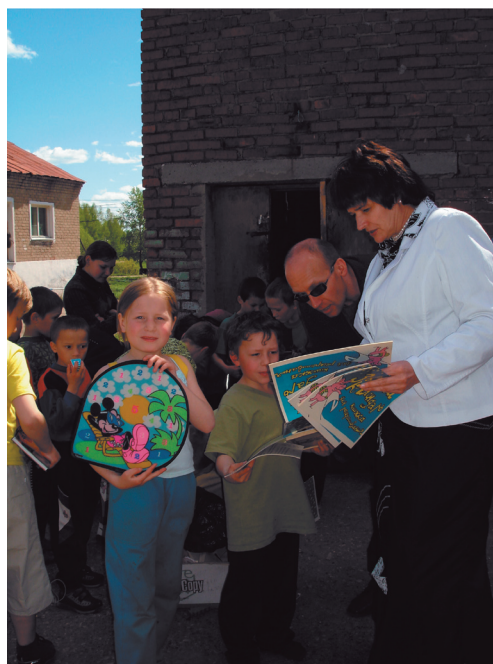
В рамках программы «Гражданские диалоги» в г. Кудымкар вручение воспитанникам детских домов подарков от жителей г. Перми