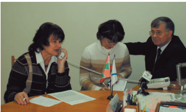
“Прямая телефонная линия” по проблемам пребывания в Пермском крае иностранных граждан и лиц без гражданства, организованная Уполномоченным по правам человека в Пермской области и Федеральной миграционной службой России по Пермскому краю.

Уникальность мероприятия заключалась в том, что семинар собрал представителей разных сторон: органов власти и общественных организаций, ведущих практическую работу по оказанию поддержки