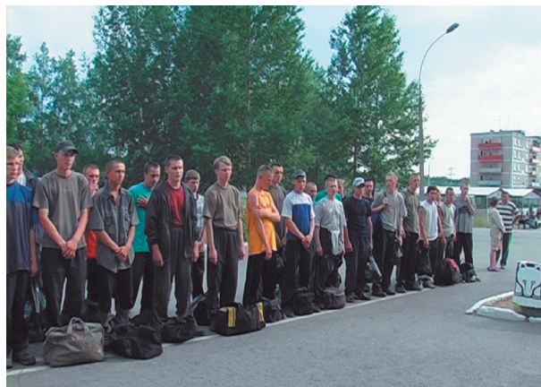
Призывники на сборном пункте Пермского края

Распространенным нарушением законодательства о призыве в регионе являлось присвоение военным комиссариатом Пермского края полномочий призывной комиссии Пермского края в нарушение закона (п.7 ст.28 Закона РФ № 53-ФЗ 28 марта 1998 года «О воинской обязанности и военной службе»).