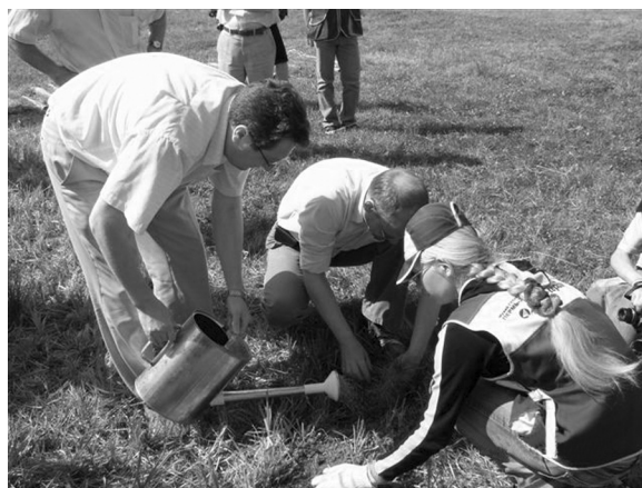
Закладка Мемориального парка «Лес памяти жертв политических репрессий»