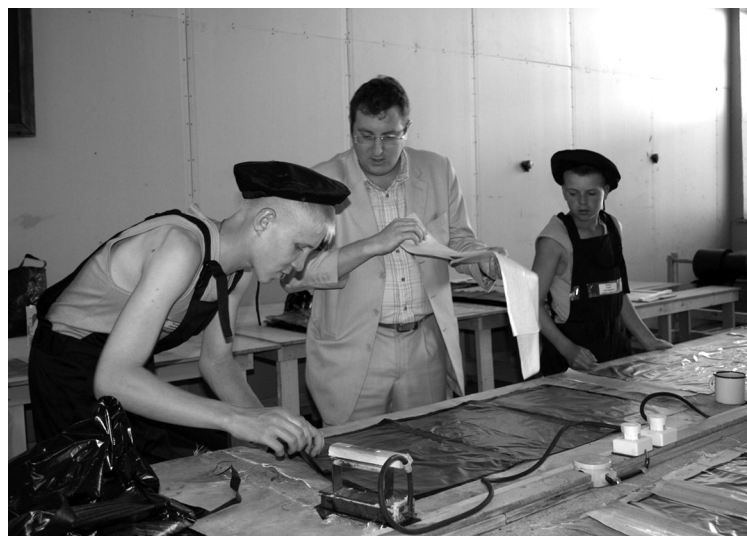
Посещение Канской воспитательной колонии в Красноярском крае в рамках совместного семинара с ГУФСИН России по Пермскому и по Красноярскому краям по теме «Проблемы организации реабилитационной работы в воспитательных колониях»

фонд крайне изношен, отсутствуют современные средства обучения.