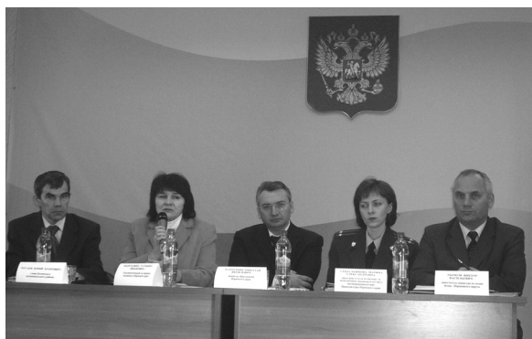
«Права учащихся в процессе модернизации образования», Общественные слушания, с. Коса, Пермский край, 24 апреля 2008 года

Для предотвращения массового нарушения прав детей Уполномоченным по правам ребенка 28 августа 2008 года в школе №5 города Кудымкар были проведены общественные слушания. И как результат – мнения ученической, родительской и педагогической общественности было учтено органами местного самоуправления.