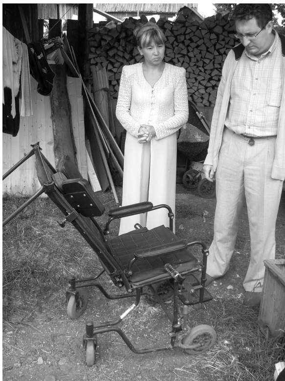
Коляска для инвалида