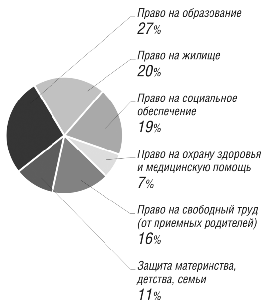
Основные нарушения прав детей в Пермском крае в 2008 году

Предметом рассмотрения Уполномоченного по правам ребенка в течение 2008 года были обращения по поводу нарушения культурных, а также социально-экономических прав детей: