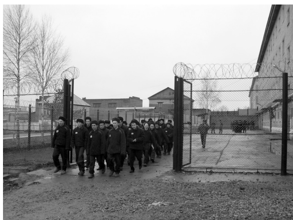
Воспитанники Пермской воспитательной колонии

(Заключительные замечания Комитета ООН по правам ребенка к третьему периодическому докладу Российской Федерации, 2005 год)