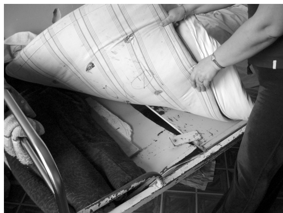
Отделение детской ортопедии и травматологии МУЗ МСЧ №9 им. М.А.Тверье г. Перми

С целью проверки информации по фактам нарушения прав детей Уполномоченным посещено отделение детской ортопедии и травматологии муниципального учреждения здравоохранения «Медсанчасть №9 им.