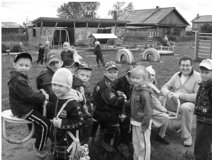
Выездной прием в пос. Гайны (Коми-Пермяцкий округ)

можно, развивать модели обучения на русском и коми-пермяцком языках, поддерживая таким образом реальное двуязычие.