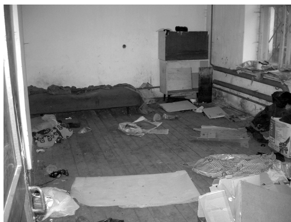
Комната для сироты

Также в 2008 году были выявлены иные нарушения прав детей-сирот на жилое помещение. По данным проверок Министерства социального развития Пермского края и Прокуратуры Пермского края в 16 территориях органами опеки попечительства в непол-