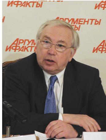
Уполномоченный по правам человека в Российской Федерации Владимир Петрович Лукин