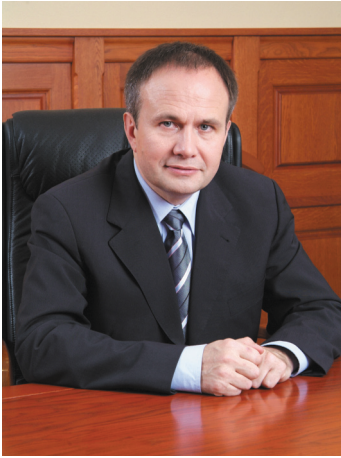
Губернатор Пермского края Олег Анатольевич Чиркунов

Уважаемые участники международной конференции «Проблема соблюдения прав человека в местах принудительного содержания»!