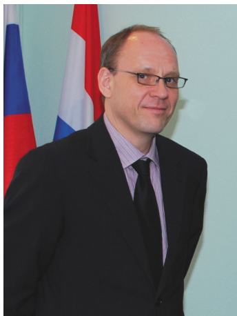
Старший советник по правам человека при системе ООН в РФ Дирк Хебеккер