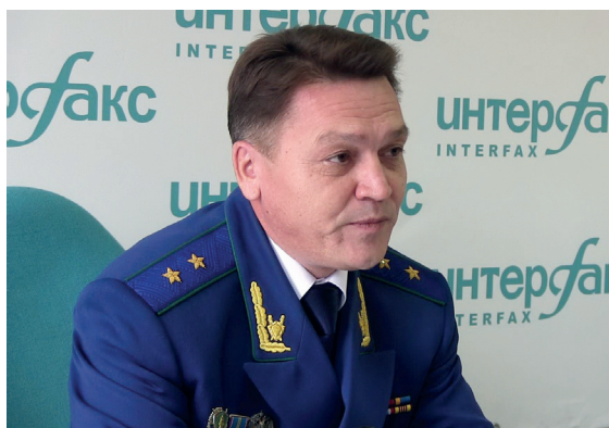
Вадим АНТИПОВ, прокурор Пермского края