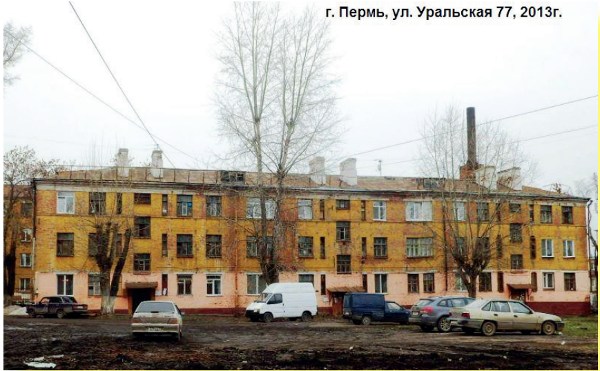
г. Пермь, ул. Уральская 77, 2013г.

С ресурсоснабжающими организациями у собственников индивидуальные прямые договора, то есть каждый владелец платит напрямую РСО, не зависимо от платежей соседа (не путать с прямыми платежами на счет РСО, при этом у РСО договор с ТСЖ или УК, то есть управляющая организация все равно обязана произвести оплату в полном объеме, иначе