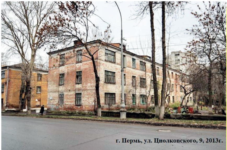
г. Пермь, ул. Циолковского, 9, 2013г.

РСО будет взыскивать долг со счета организации, а та, в свою очередь, с неплательщика).