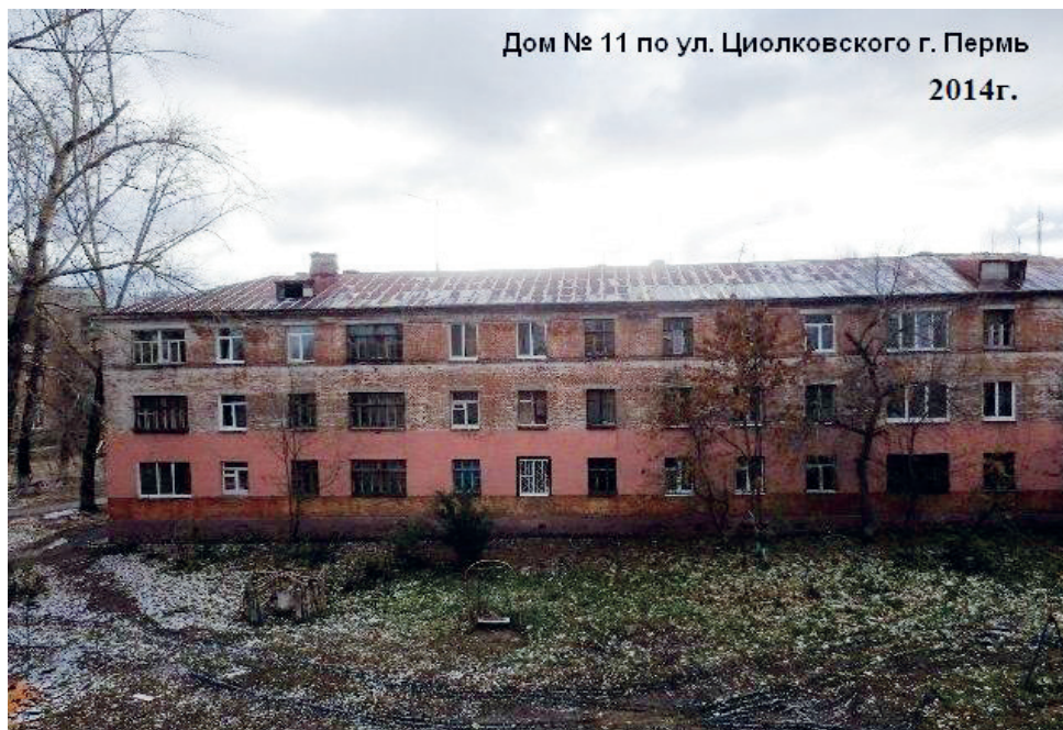
Дом № 11 по ул. Циолковского г. Пермь 2014г.

На Циолковского, 9 в 2014 году завершился комплексный капитальный ремонт. Уральская, 77, Циолковского, 11, В. Фигнер, 5 находятся в