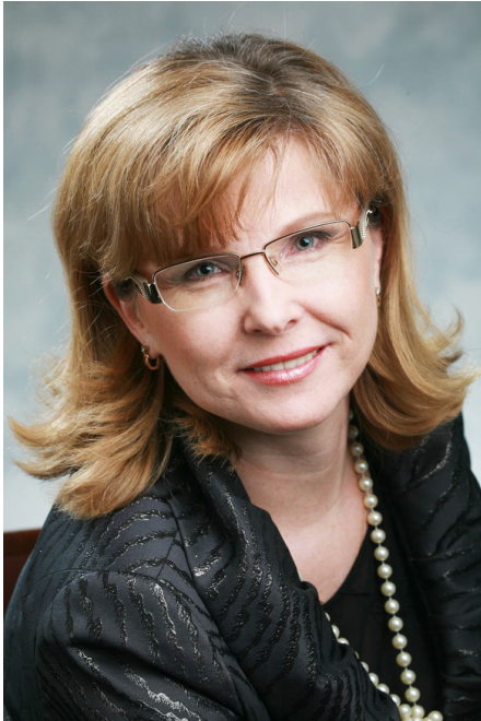
Ольга АНТИПОВА, начальник Инспекции государственного строительного надзора Пермского края с 2006 по 2014 годы

тором живут. Они не должны самоустраняться от решения вопроса управления своим имуществом, своим многоквартирным домом, ведь от того, насколько активны собственники при принятии решений, зависит комфортность проживания в домах.