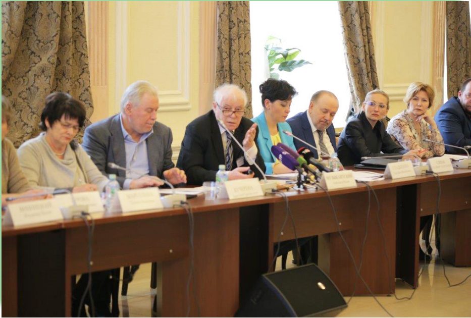
Круглый стол Общественной палаты Российской Федерации по проблеме сноса жилых построек вблизи нефтегазовых трубопроводов, 2017 год

29 апреля 1992 года, Постановлением Госгортехнадзора России от 22 апреля 1992 года №9);