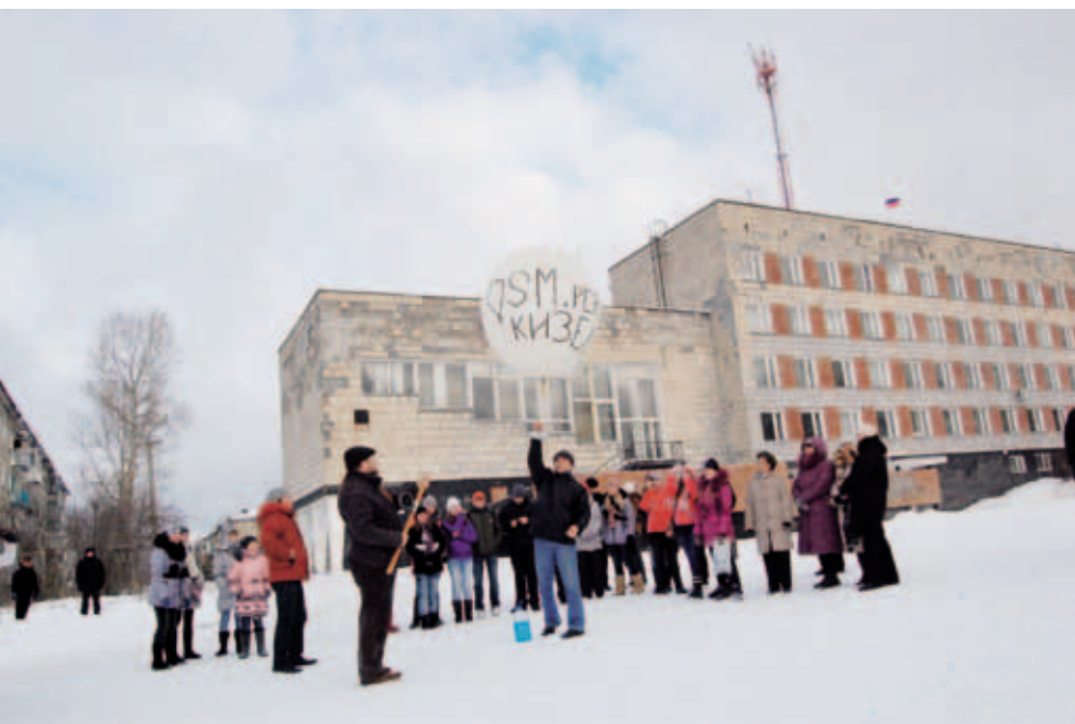
Проект «Открытые карты Пермского края». Запуск метеорологического зонда с фотоаппаратом для проведения аэрофотосъемки. Ноябрь 2011. Кизел

Эти первые проекты показывают уникальные возможности краудсорсинга – совместного решения задач в он-лайн среде большими группами людей.