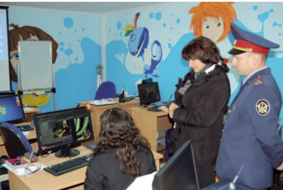
Уполномоченный по правам человека в Пермском крае в женской исправительной колонии – 32

датайства в суд. (Статистика нуждающихся, прошедших через суд и не доживших до суда.)