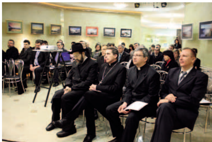
Первый Пермский региональный молитвенный завтрак. Ноябрь 2011. Пермь

бежья. В рамках выставки состоялись различные круглые столы, презентации православных учебных заведений.