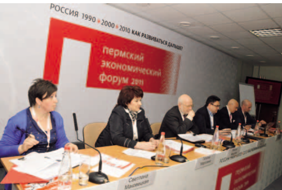
Заседание Совета по развитию гражданского общества и правам человека при Президенте РФ. Апрель 2011. Пермь

в Прикамье, проводить ежегодный мониторинг соблюдения прав детей;