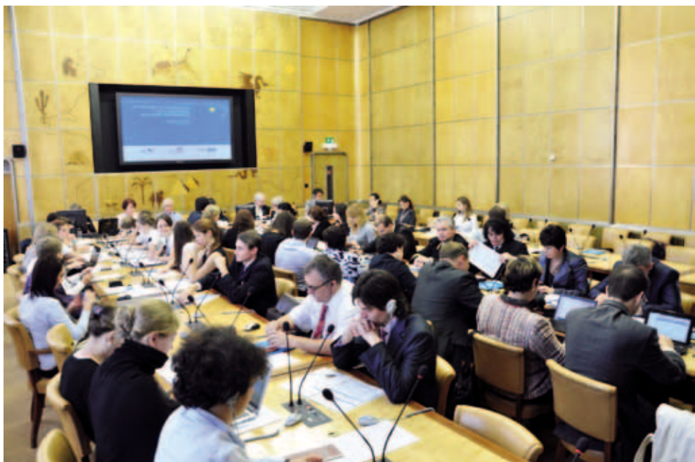
Участие Пермской делегации волонтеров АНО «Организация «Вектор Дружбы» в II Международной конференции «Общественная дипломатия и молодежное добровольчество». Октябрь 2011. Женева. Дворец Наций (ООН)

Помимо этого, в числе основных направлений деятельности организации реализация краевых, межрегиональных и международных проектов: в партнерстве с Европейским отделением Международного союза адвокатов и Торговой палатой Россия-Швейцария – организация молодежных обучающих и ознакомительных программ, проект «Край равных