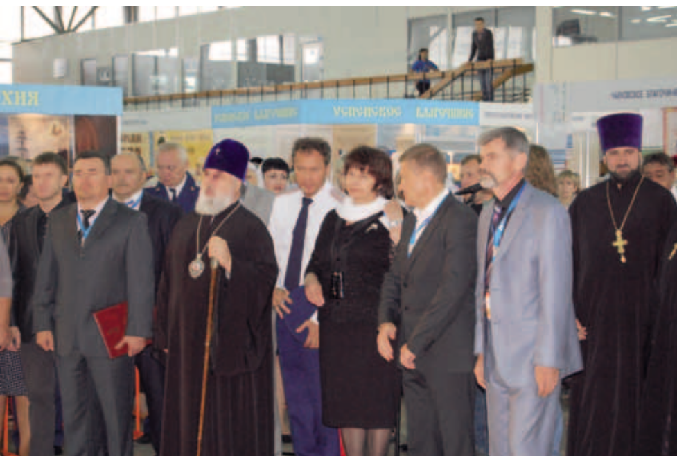
Открытие выставки «Православная Русь». Август 2011. Пермь