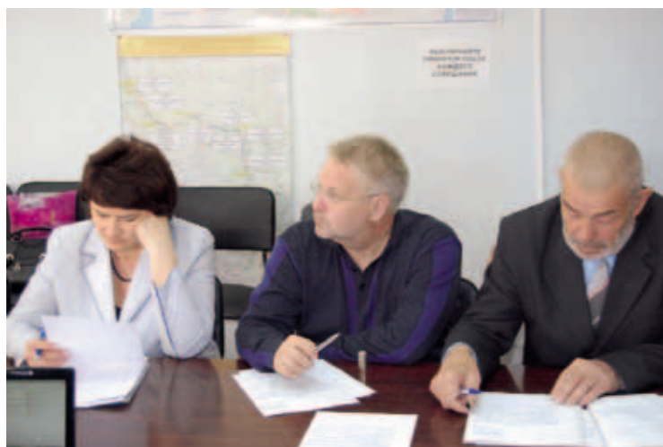
Переговорная площадка с РЖД о доступности остановочных комплексов. Пермь

гия оказания бесплатной квалифицированной юридической помощи населению края на базе районных библиотек. Так, в результате более 8 тыс. жителей края получили от них консультации и юридическое сопровождение в судах, благодаря их проекту в Российской Федерации государственные заказы на эту услугу могут быть теперь размещены и в некоммерческом секторе.