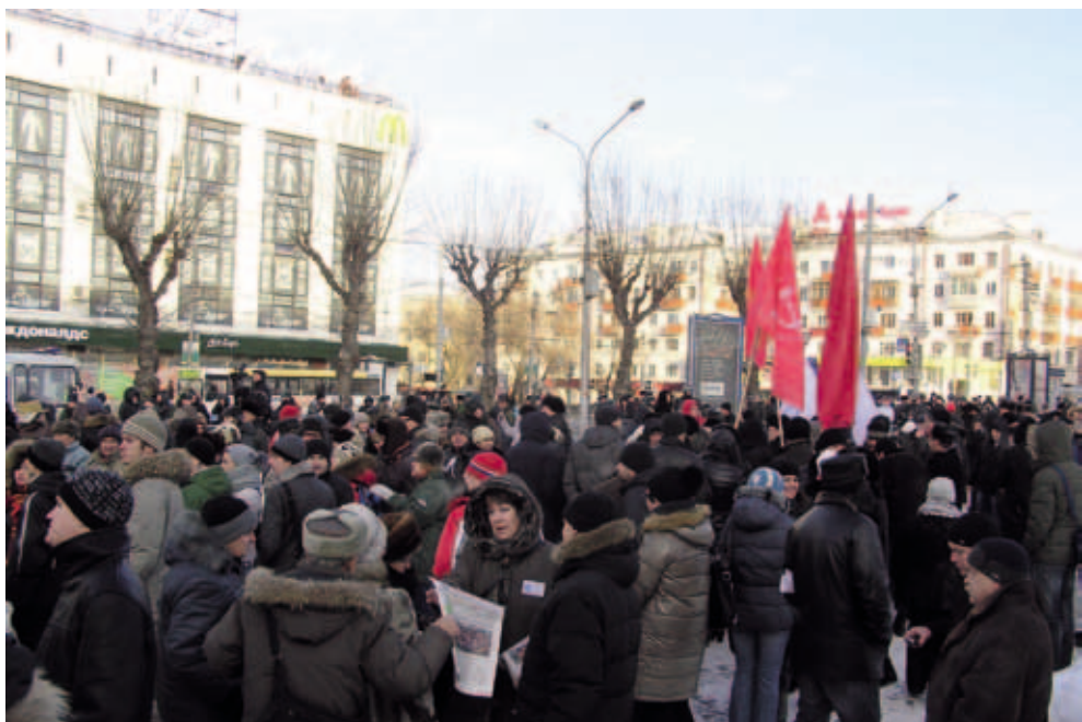
Акция «За честные выборы». 11 декабря 2011г. Пермь

Отметим, что избирательный участок является общественным местом, а члены комиссий, давая свое согласие на вхождение в их состав, становятся публичными фигура-