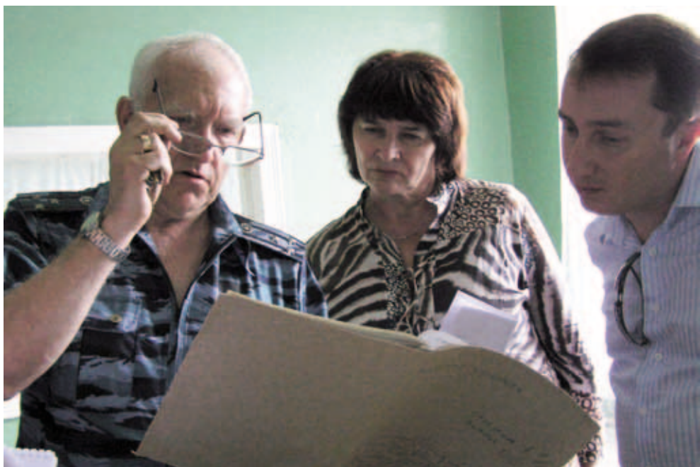
Уполномоченный по правам человека в Пермском крае в больнице исправительной колонии – 9 ГУФСИН России по Пермскому краю. Июль 2011. Соликамск

стоящее время отсутствует возможность проводить лучевую терапию осужденным с госпитализацией в стационар Пермской краевой онкологической больницы.