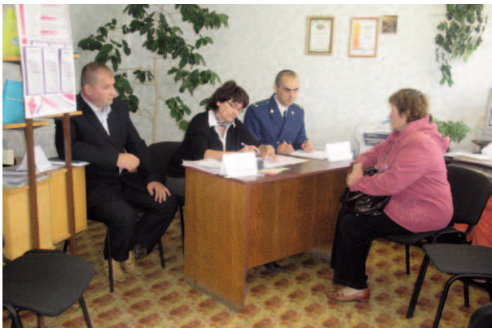
Кизеловская межпоселенческая библиотека. Прием граждан. Ноябрь 2011

В целом в 2011 году произошло поэтапное увеличение