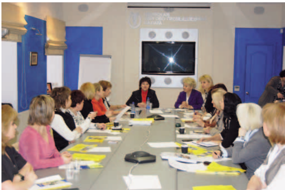
Клуб деловых женщин в Торгово-промышленной Палате Пермского края. Пермь

Одним из институтов защиты свободы предпринимательской деятельности может быть омбудсман. Эти предложения были сформулированы Пермской торгово-промышленной палатой и Центром «ГРАНИ». Инициатива была поддержана губернатором Пермского края и Уполномоченным по правам человека. В настоящее время в Законодательное Собрание вне-