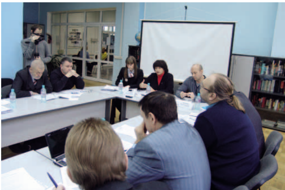
Обсуждение закона «Об общественном (гражданском) контроле в Пермском крае». Ноябрь 2011. Пермь

Отдельно в Законе прописана процедура наделения полномочиями членов региональной группы, кандидатуры в состав которой имеют право выдвигать некоммерческие организации. Специально для реализации мероприятий по общественному (гражданскому) контролю предусматривается создание Комиссии при Общественной палате Пермского края, не менее половины которой также должны составлять представители некоммерческих организаций. С этой целью Уполномоченным по правам человека в рамках законодательной инициативы были внесены изменения в Закон Пермского края «Об Общественной палате Перм-