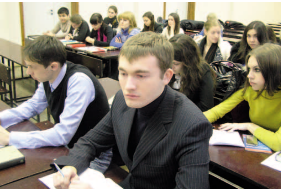
Курс права человека на юридическом факультете Пермского государственного национального исследовательского университета

В 2010 году была принята Хартия Совета Европы о воспитании демократической гражданственности и образовании в области прав человека в рамках Рекомендации Комитета министров Совета Европы, что представляет собой важный этап в работе Совета Европы и международного правозащитного сообщества в области гражданского образования.