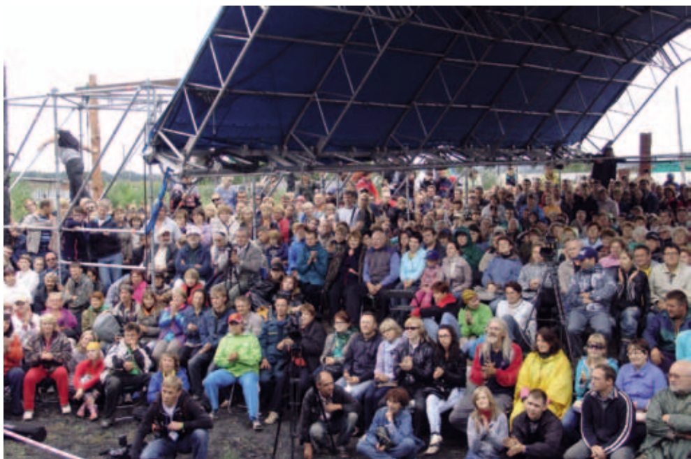
VII Международный гражданский форум «Пилорама-2011»