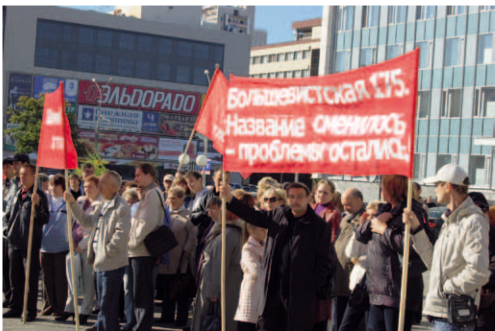
Митинг обманутых дольщиков. Август 2011. Пермь

- вернуть органам местного самоуправления полномочия по проверке деятельности УК в МКД по обращениям собственников;