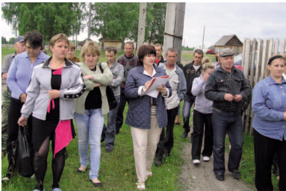
На встрече Уполномоченного по правам человека в Пермском крае Т.И. Марголиной с жителями поселка и сотрудниками психоневрологического интерната. Июль 2011. Поселок Булатово, Красновишерский район