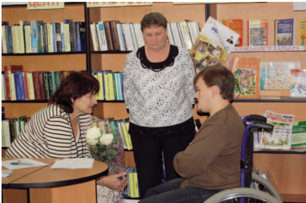
Прием в Красновишерске. Как решить проблемы о переселении инвалида на первый этаж?

1. Снята возможность субъективного подхода в отказе постановки на учет нуждающихся в жилых помещениях социального использования. Законодательная инициатива Уполномоченного по правам человека в Пермском крае уточнила основания, по которым можно отказать нуждающемуся в постановке на учет. Изменения в Закон Пермского края «О порядке ведения органами местного самоуправления учета граждан в качестве нуждающихся в жилых помещениях, предоставляемых по договорам социального найма» № 2694-601