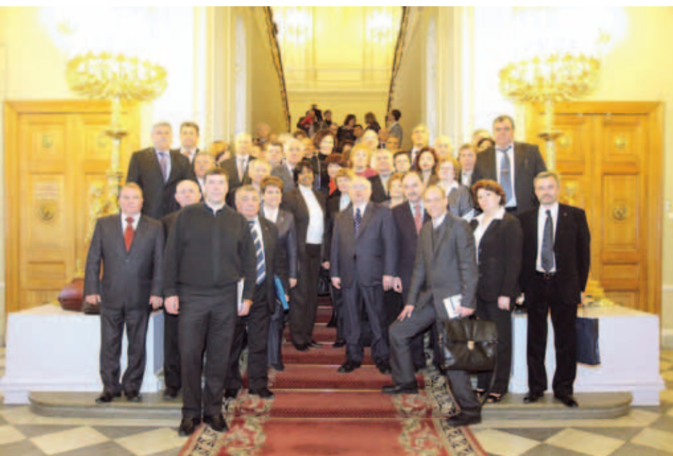
Российские уполномоченные по правам человека на встрече с Верховным комиссаром ООН по правам человека Наванетхем Пиллэй. Февраль 2011. Санкт-Петербург

Согласно ст. 11 Закона Пермского края 05.08.2007 № 77-ПК «Об Уполномоченном по правам человека в Пермском крае», одной из основных задач Уполномоченного является содействие развитию международного сотрудничества в области прав и свобод человека.