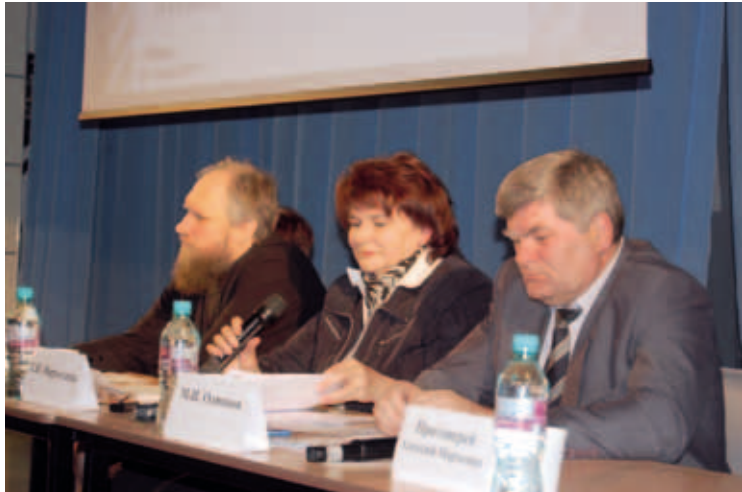
Международный симпозиум «Свобода совести и культура духовности». Май 2011. Пермь