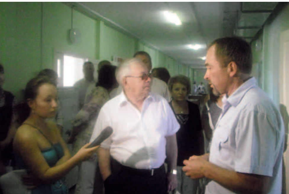
Посещение Уполномоченным по правам человека в Российской Федерации В.П. Лукиным психиатрического стационара в д. Байболовка Пермского края. Июль 2011