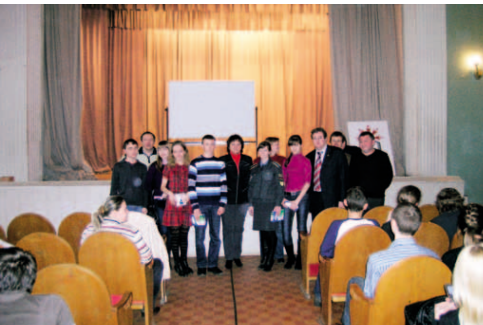
Победители XI Пермской городской открытой олимпиады по правам человека среди учащихся 9-11 классов. Апрель 2011. Пермь

и гражданскому образованию детей и взрослых Пермского края. В течение года организовывались различного уровня переговорные площадки с участием представителей некоммерческих организаций, представителей органов исполнительной власти для дальнейшей разработки единой концепции развития гражданского образования и правового просвещения в крае, а также продолжения действия Программы развития политической культуры и гражданского образования населения Пермского края в 2012 году и последующие годы.