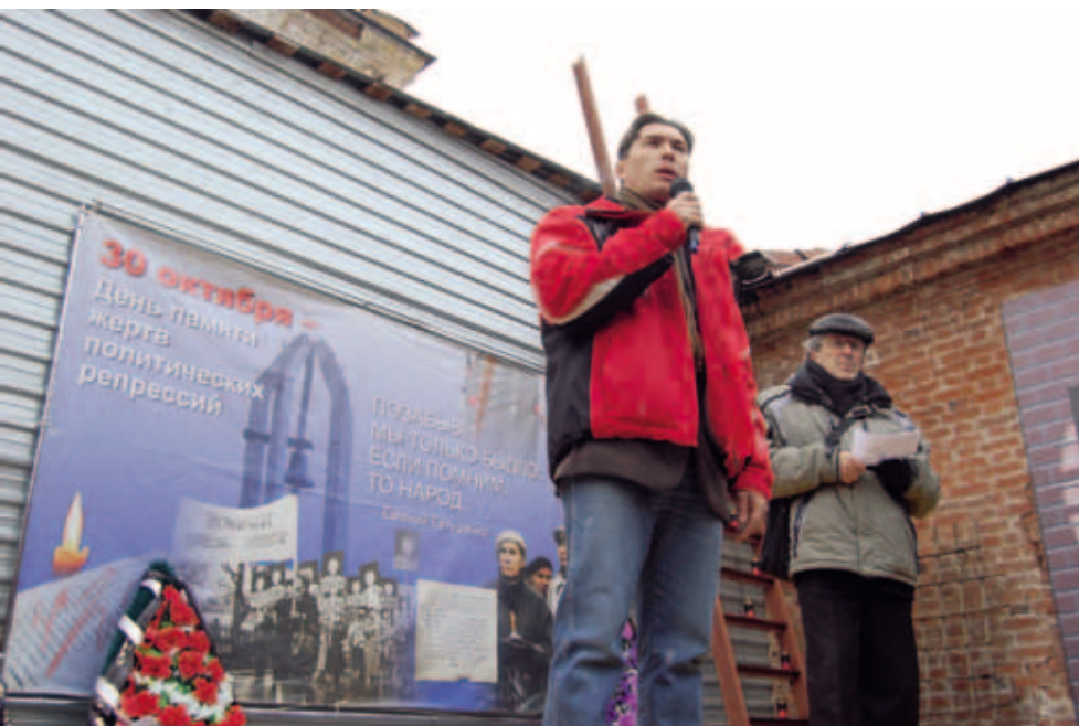
День памяти жертв политических репрессий. Пермь