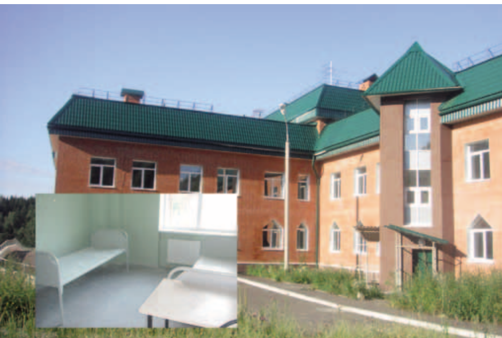
Новый корпус Пермской краевой клинической психиатрической больницы в микрорайоне Банная гора. Июль 2011

Как было отмечено на заседании, психические заболевания – серьезная медико-социальная проблема современного общества. По данным Всемирной Организации Здравоохранения (ВОЗ) более 450 млн людей в мире имеют психические отклонения. По прогнозам ВОЗ, к 2020 году психические расстройства войдут в первую пятерку болезней, ведущих к потере трудоспособности.