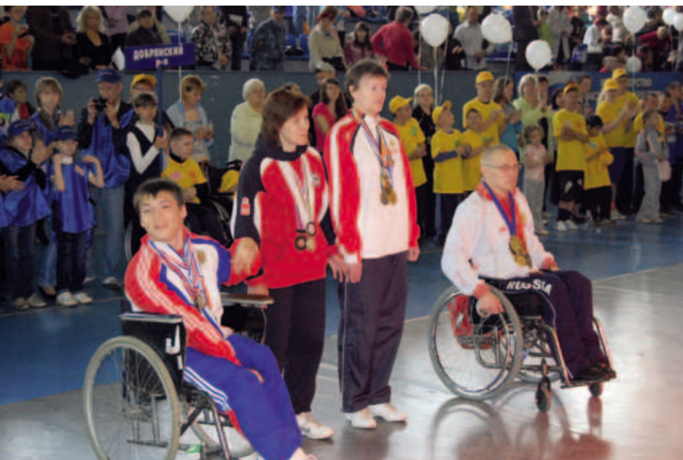
Фестиваль спорта инвалидов. Манеж Спартак

колясках в здании аэропорта и на прилегающей территории.