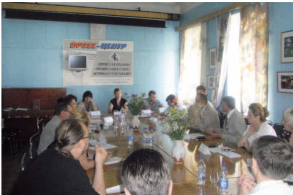
Круглый стол «Экстремизм сегодня: формы и степени проявления, проблемы определения». Июль 2011. Пермь

Эти рекомендации, судя по настроению руководителей средств массовой информации, будут выполнены, поскольку муниципальные редакции серьезно зависят от финансовой поддержки краевой власти и органов МСУ. А результатом такого «избирательного молчания» станет не только нарушение конституционных прав граждан на получение своевременной и достоверной информации, но и отказ кандидатам в депутаты Законодательного Собрания в доступе к печатной