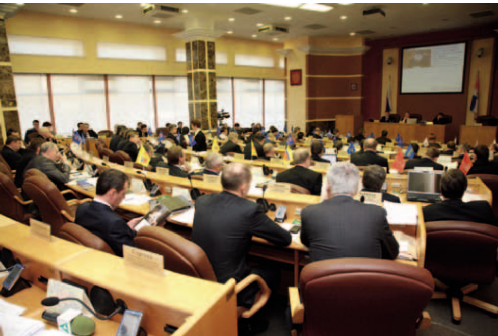
Заседание Законодательного Собрания Пермского края