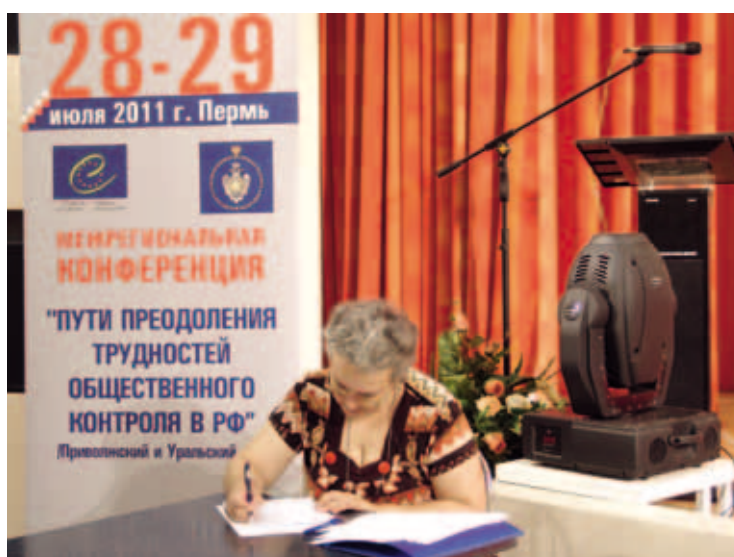
Межрегиональная конференция по общественному контролю мест принудительного содержания. Июль 2011. Пермь