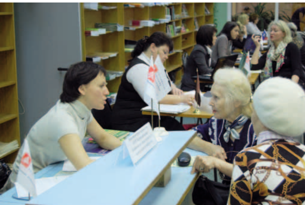
Совместные консультации аппарата Уполномоченного по правам человека в Пермском крае и Российской гильдии риэлторов в Пермском крае. Пермь

Рассматриваются возможности внедрения и апробации в секторе ЖКХ технологий медиации для урегулирования конфликтов.